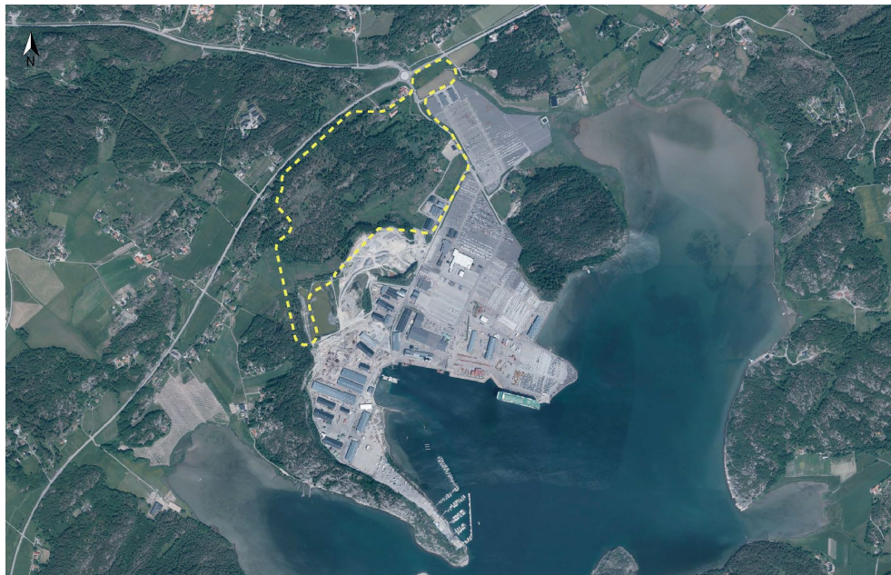
Planområdes ungefärliga avgränsning markerad med streckad gul linje.