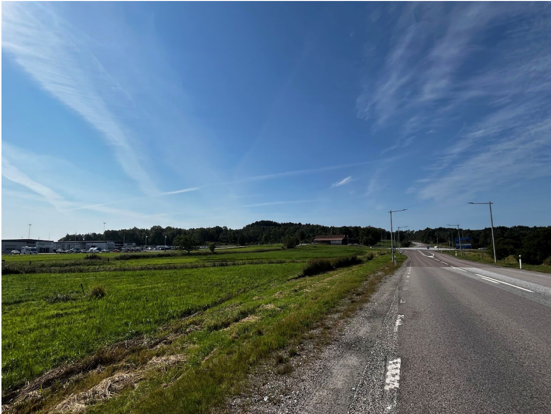
Vy 1: Från väg 169, öster om Vallhamns-cirkulationen.