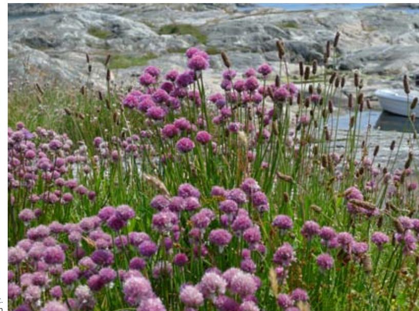
Strandpilt.