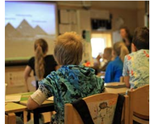
Lektion i matematik på Fridas Hage.

Dessutom har Västtrafik höjt sina priser med 8 procent medan budgeterad höjning var