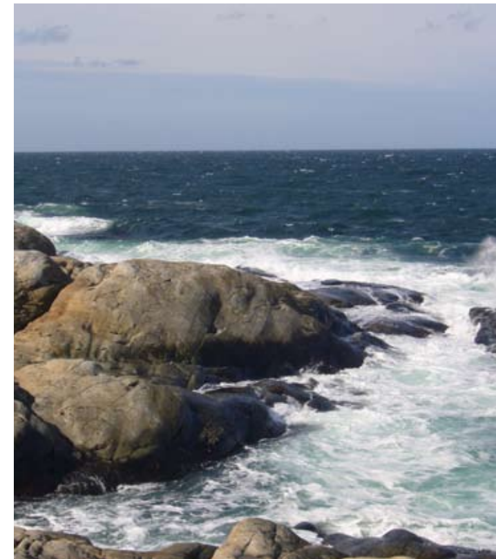
Skummande hav.

Samhällsbyggnadsnämnden hanterar flera områden: plan- och byggfrågor, mark- och exploateringsfrågor, miljö- och