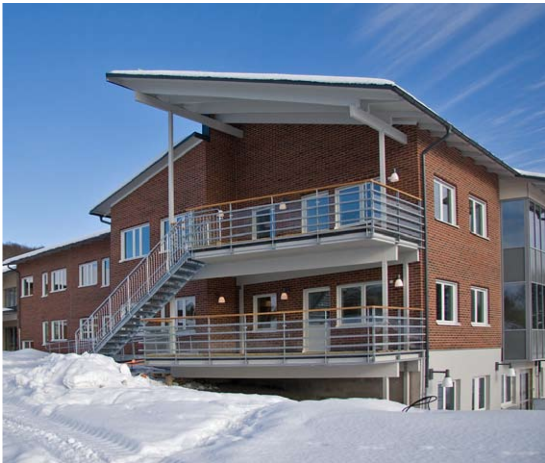
Valåsens äldreboende i Källekärr.