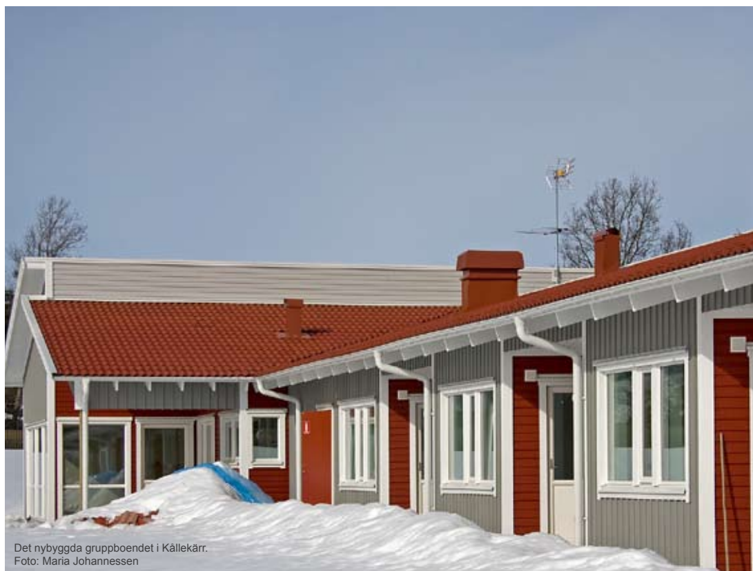
Det nybyggda gruppbostället i Källekärr.