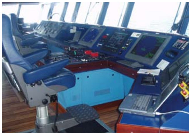
Som matros går du ibland vakt på "bryggan"

Många av våra elever väljer att studera vidare efter gymnasiet. För att Du som elev skall vara så förberedd som möjligt inför framtida studier för vi hela tiden diskussioner med Sjöbefälsskolorna i Göteborg och Kalmar om vilka kunskaper eleverna förväntas ha innan de tar ett steg vidare i karriären.