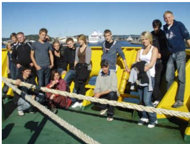
Studiebesök på Baltic Press

Motormännen arbetar i maskinavdelningen och deras främsta arbetsuppgift är maskinernas skötsel, passning och underhållsarbeten på fartygets maskineri. Liksom matrosen ingår motormannen i fartygets säkerhetsorganisation.