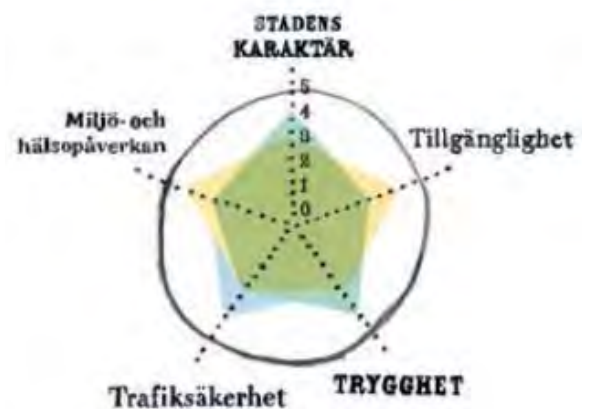
Värderas med TRAST-metodens kvalitetsaspekter

I TRAST-metoden belyses trafikfrågor dels utifrån ett antal trafikslag och dels utifrån ett antal kvalitetsaspekter, se bilder. Vid jämförelse mellan de teman som fokusgrupperna viktat högt och de trafikslag/kvalitetsaspekter som TRAST omfattar, finns tydlig överensstämmelse på flera punkter.